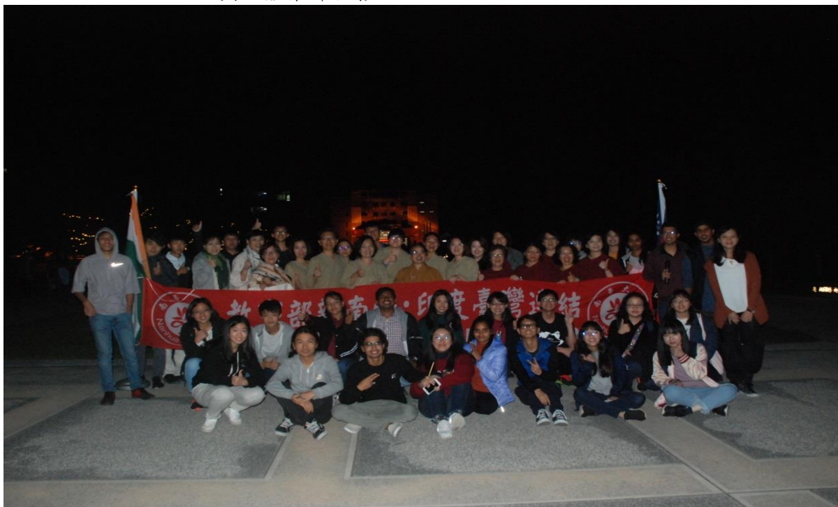
與南亞學生全體合影