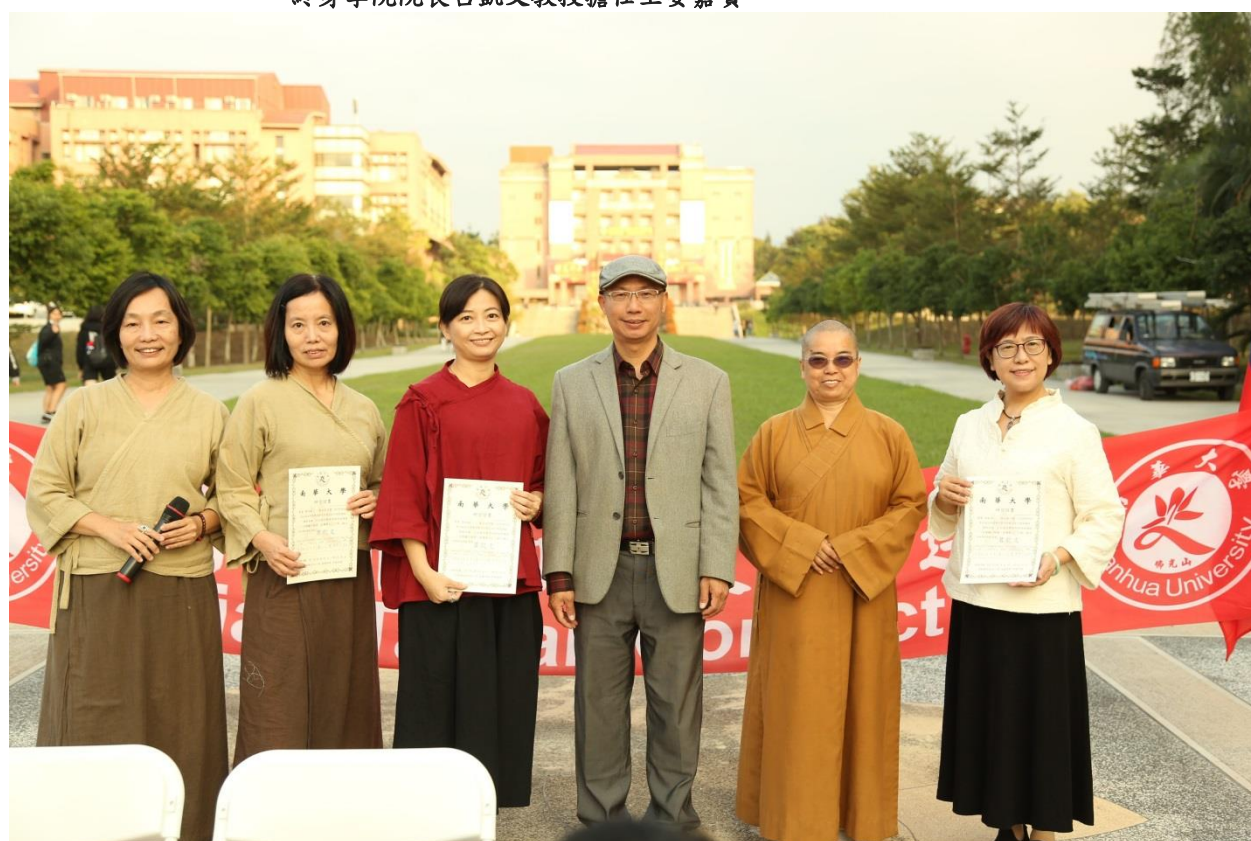
藉此機緣頒獎給正念指導師證照