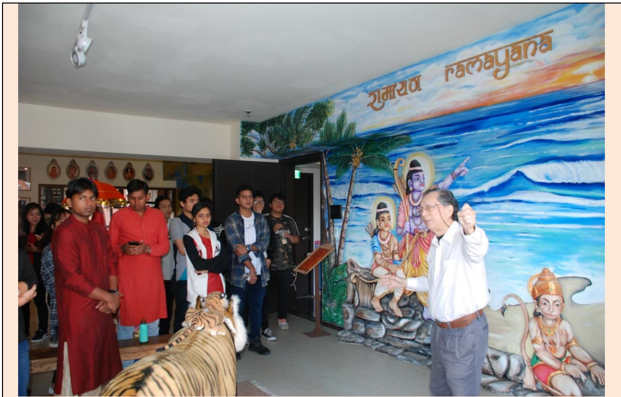
夢想印度博物館吳朗德館長向印度學生講說