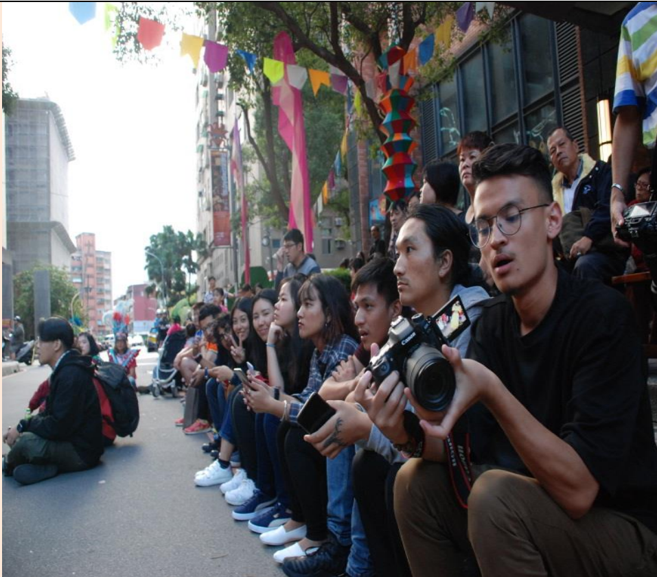
KIIT University 交換生表演

「2018年亞洲印度文化節」由新北市政府文化局、臺北市文化局及臺北印度愛樂中心共同合辦。今年邀請到來自印度的「卡拉曼達拉許朱舞劇團」，演繹《宗廟舞姬-香料傳奇》，讓民眾透過「香料文化」來認識印度、了解印度。印度文化節已經連續辦理16年，而近兩年來印度文化節擴大辦理，變成「亞洲印度文化」，所以表演者有台灣、印度、香港、日本、中國等地的知名舞者都前來共襄盛舉。今年《宗廟舞姬-香料傳奇》以16世紀「大航海時代」印度香料故事為背景，敘述伊斯蘭和葡萄牙人在印度引發的商業經營與愛情的故事，香料貿易不僅成為改變世界地圖的原動力，也使印度成為宗教及東西方文化融合的大熔爐，具有重要的歷史意義，也讓南亞同學更了解印度文化的影響力。