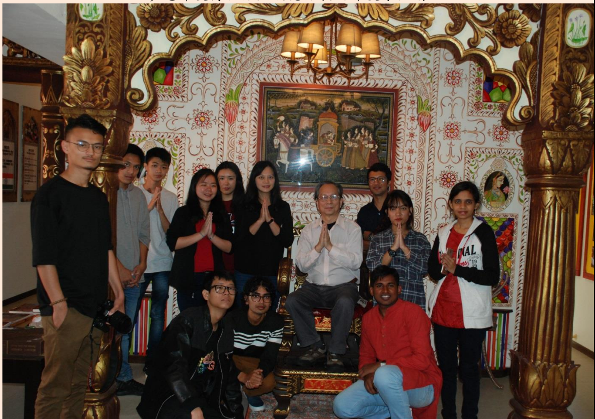
在印度博物館合影