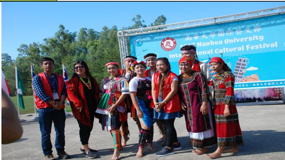
族群特色的原住民舞蹈