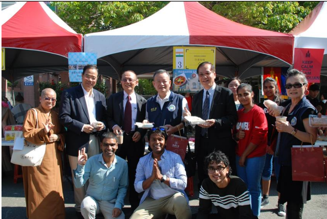
林校長及吳副校長、林副校長陪同雲嘉南外交部官員品嚐印度美食