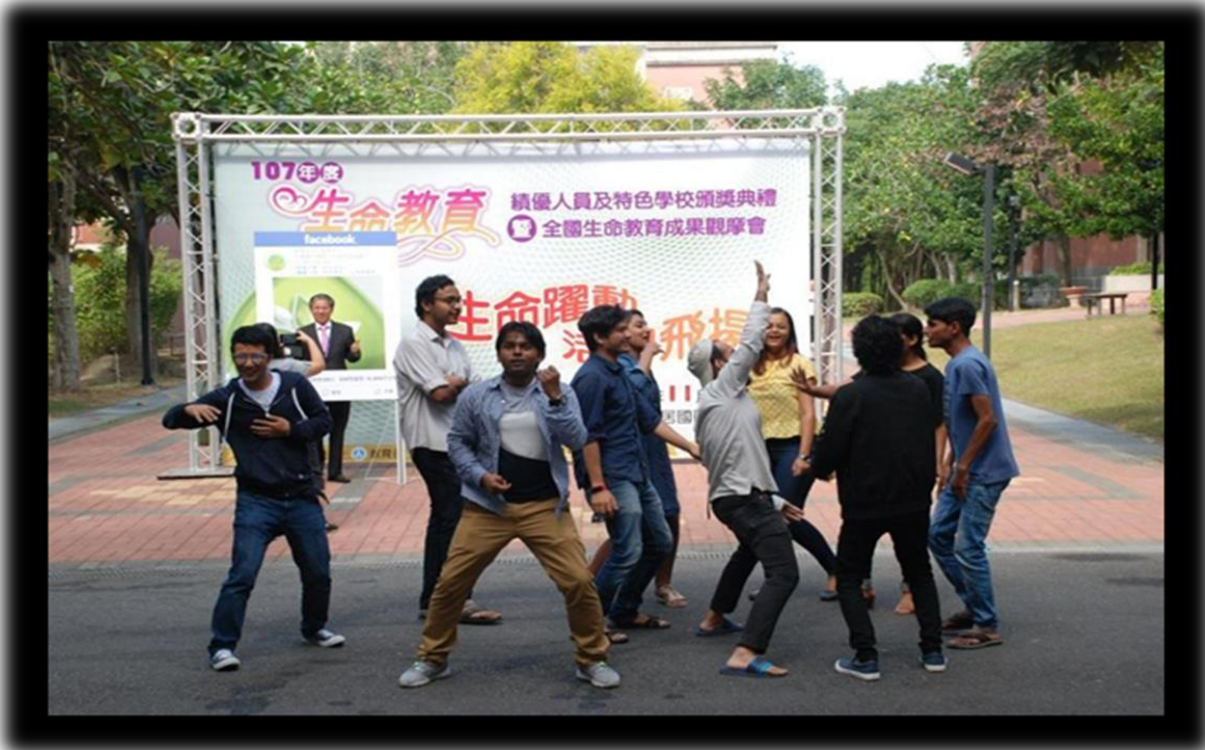
南亞學生戶外場的自由舞蹈迎賓