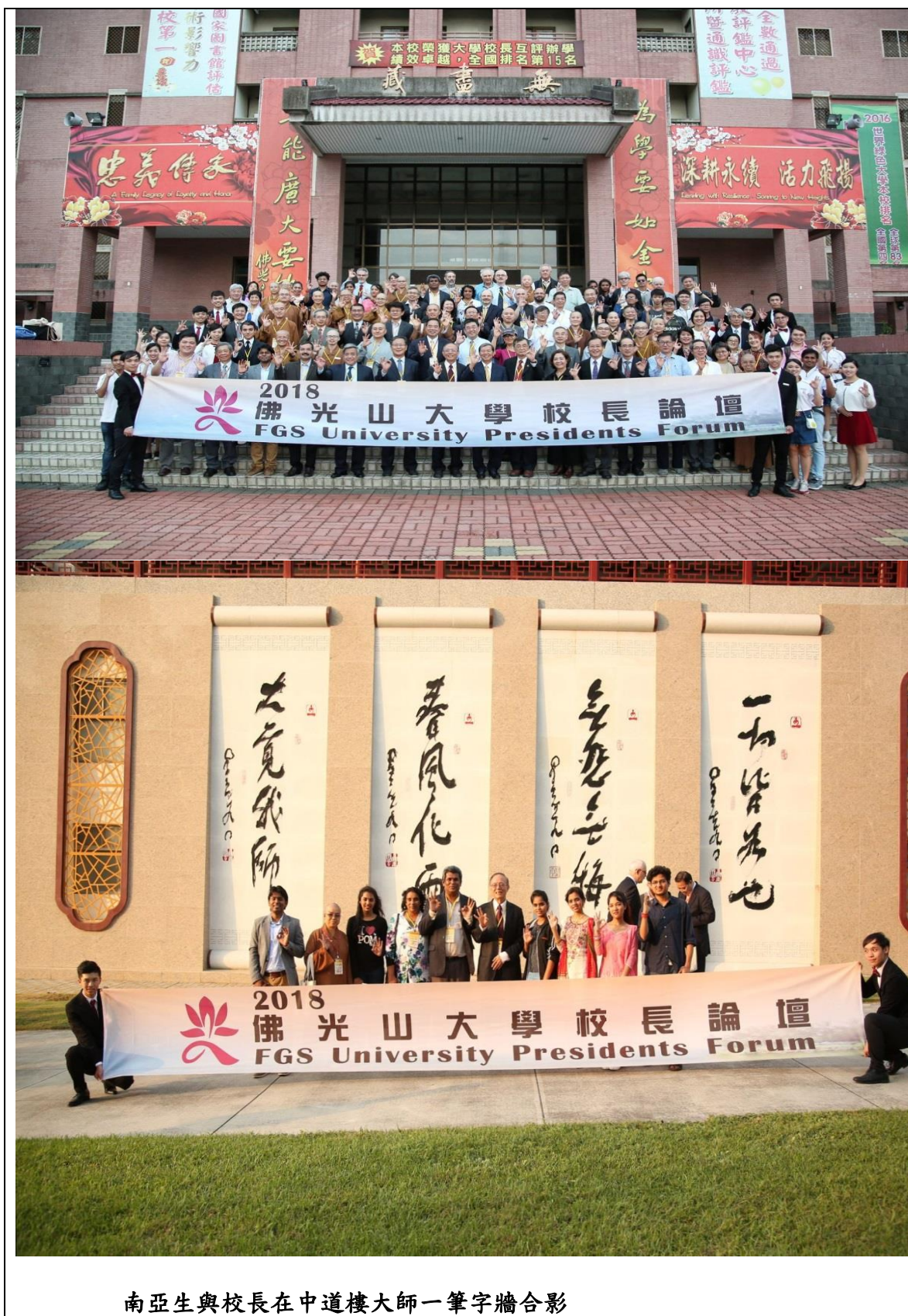
南亞生與校長在中道樓大師一筆字牆合影