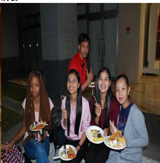
邀請外籍同學同樂