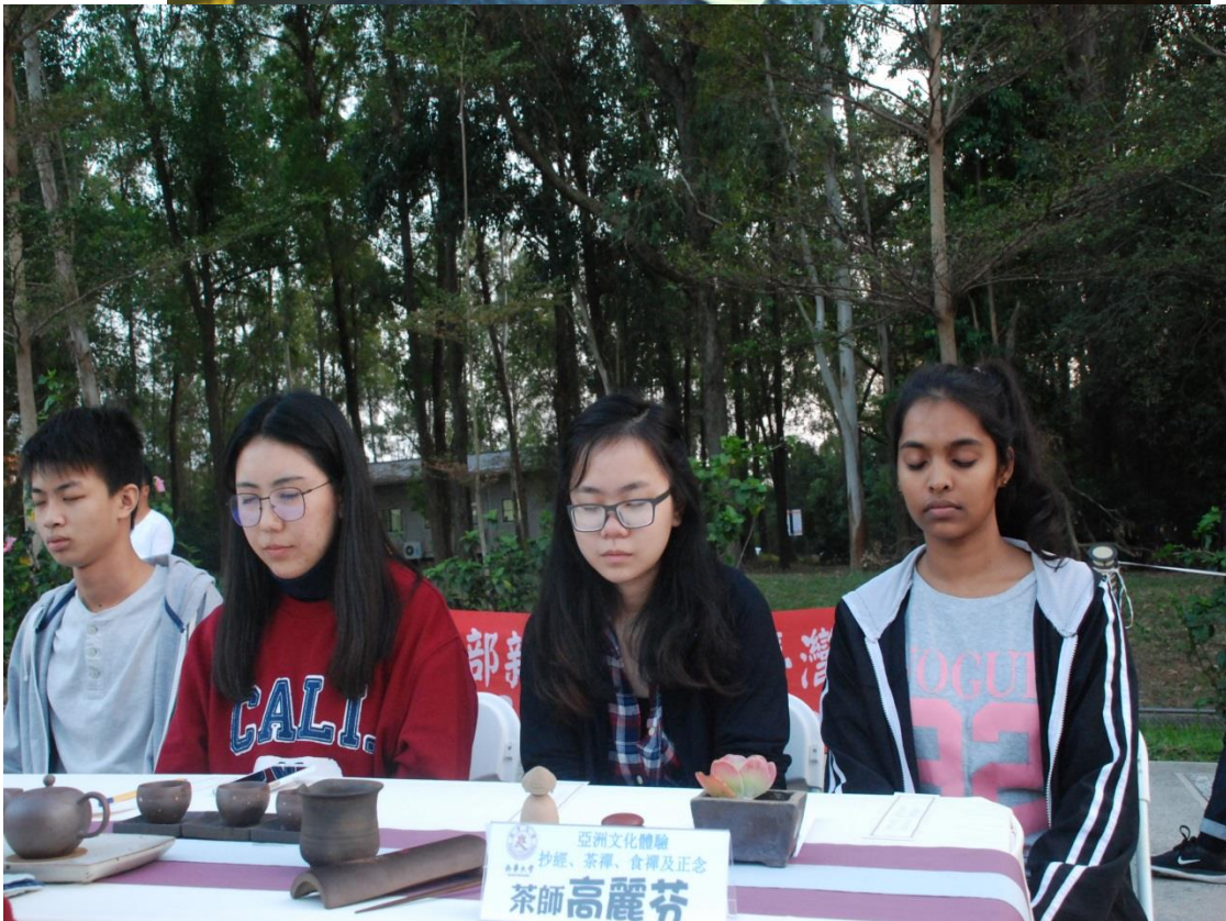
茶席中同學們靜坐