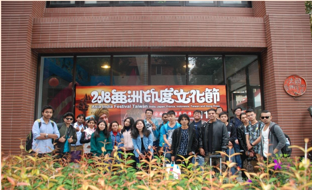
南華大學南亞學生出席 2018 亞洲印度文化節