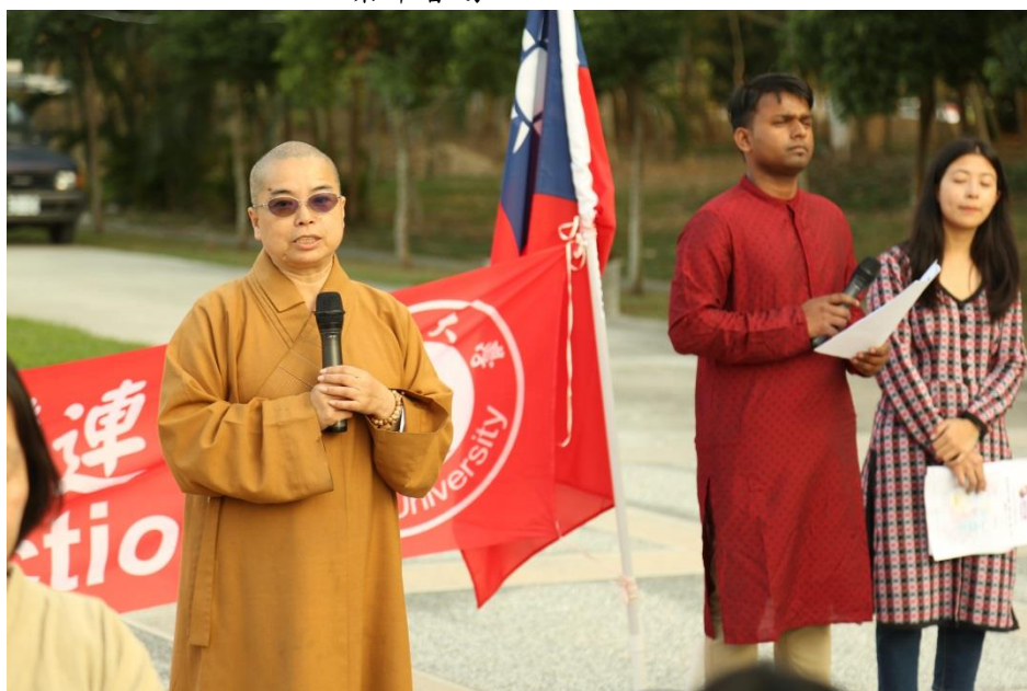
開場致詞，由達喜與采潔擔任翻譯